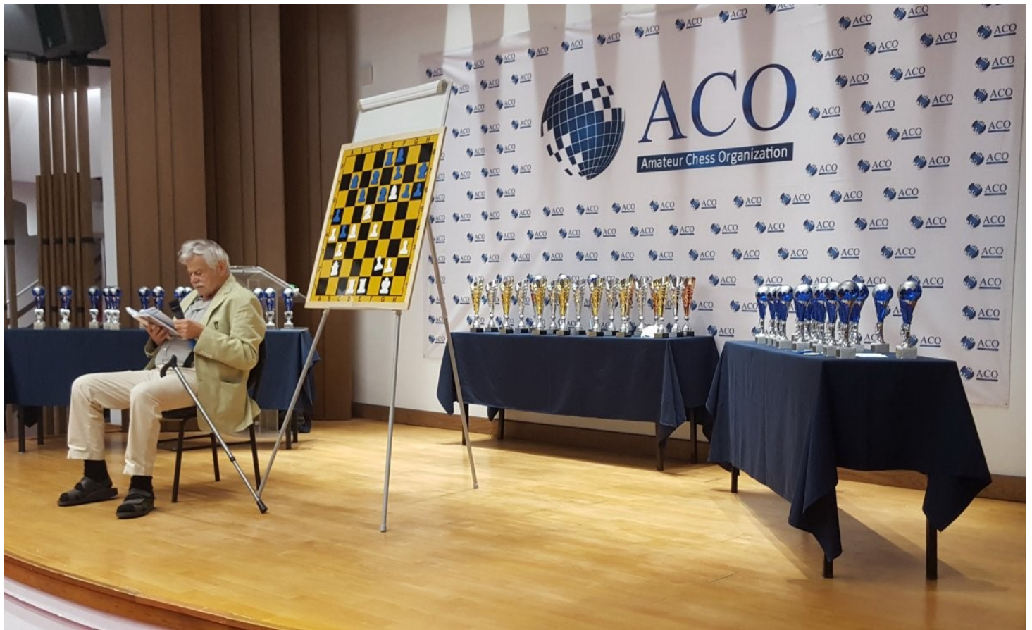
A Németországot képviselő cseh sakklegenda, Vlastimil Hort nagymester előadása